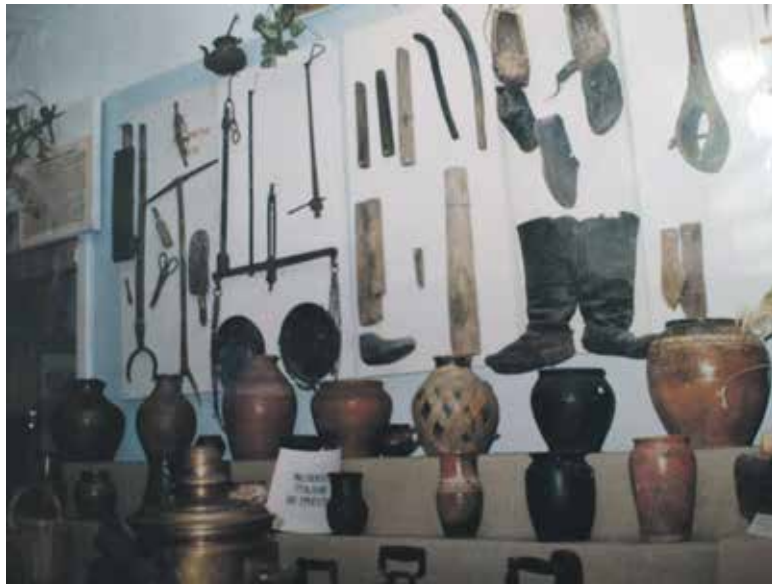
Этнографическая экспозиция Болотнинского районного историко-краеведческого музея в 1990-х годах в прежнем помещении в Доме культуры